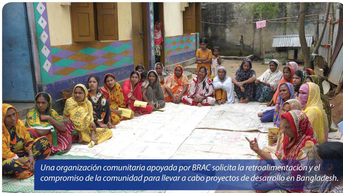
Una organización comunitaria apoyada por BRAC solicita la retroalimentación y el compromiso de la comunidad para llevar a cabo proyectos de desarrollo en Bangladesh.

En última instancia, el modelo de legitimidad inherente a la filantropía comunitaria recae sobre el tema del poder de los donantes para hacer cambios positivos en sus comunidades. Debido a que los residentes locales son los propios donantes y por tanto son el sostén del esfuerzo, esta legitimidad se mantiene o se derrumba en base a la opinión de la población local acerca de la buena o mala administración de la institución que están apoyando. Si no es bien administrada, retirarán su apoyo. Por lo tanto, las fundaciones comunitarias y otras organizaciones similares, deben rendir cuentas a sus comunidades de una forma que los donantes externos no hacen. Adicionalmente, estos comportamientos crean normas que la sociedad respeta y espera de sus líderes, lo cual a su vez construye la base para una sociedad más transparente y democrática. Este es el atributo fundamental de la filantropía comunitaria, lo que la hace extremadamente importante para la “construcción del Estado» en la agenda de la cooperación al desarrollo internacional, en particular en los cuarenta y cinco llamados estados frágiles. 13