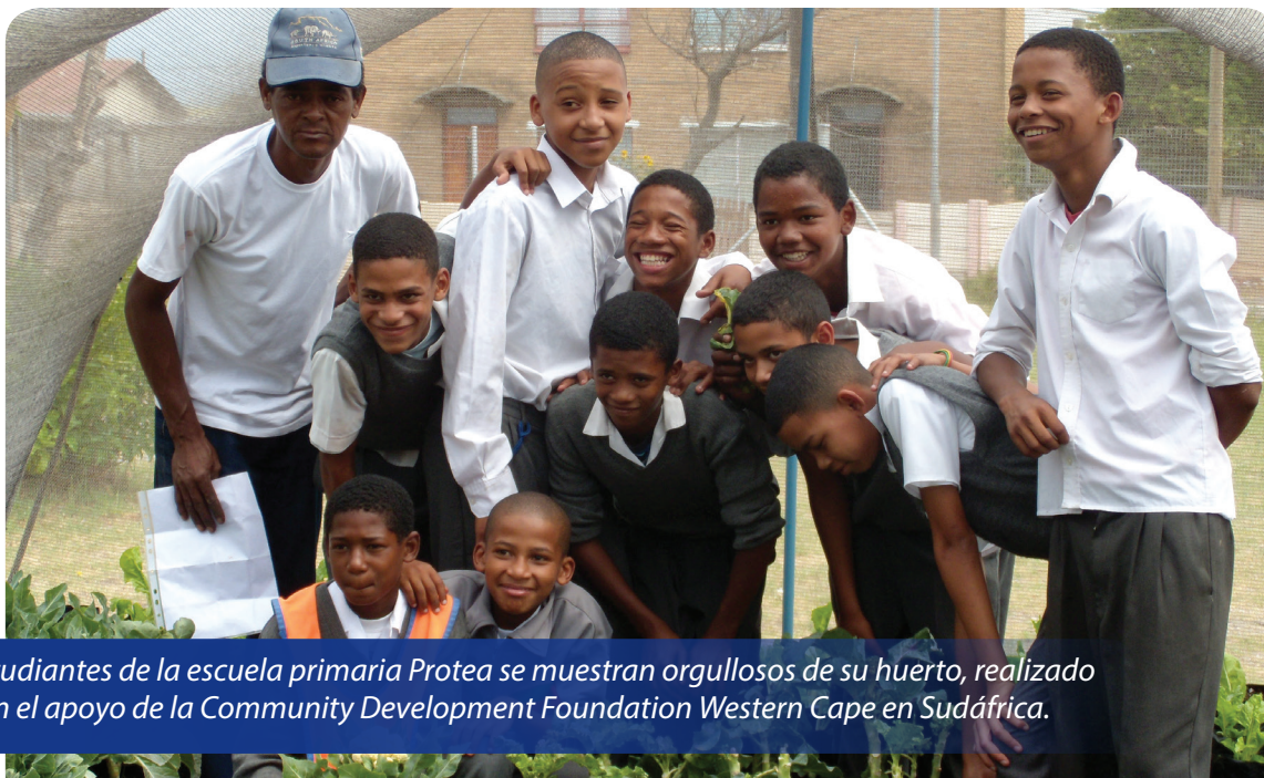
Estudiantes de la escuela primaria Protea se muestran orgullosos de su huerto, realizado con el apoyo de la Community Development Foundation Western Cape en Sudáfrica.

plenamente que estos factores eran resultados buenos y valiosos de la filantropía comunitaria.